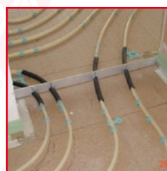
Schutzrohr bei Biofaser Lochplatte