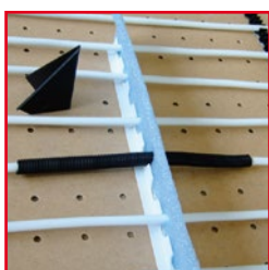
Schutzrohr 13/16 mm mit Aufziehwerkzeug