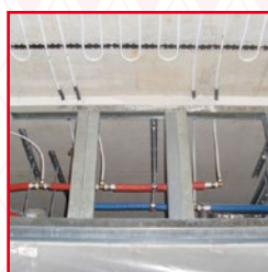
Schutzrohr 13/16 mm bei Wanddurchführung